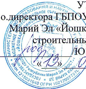
ГРАФИК ПРОВЕДЕНИЯ ГОСУДАРСТВЕННОЙ ИТОГОВОЙ АТТЕСТАЦИИ ВЫПУСКНИКОВ ПО СПЕЦИАЛЬНОСТЯМ 40.02.01 Право и организация социального обеспечения, 21.02.05 Земельно-имущественные отношения, 38.02.01 Экономика и бухгалтерский учет (по отраслям)